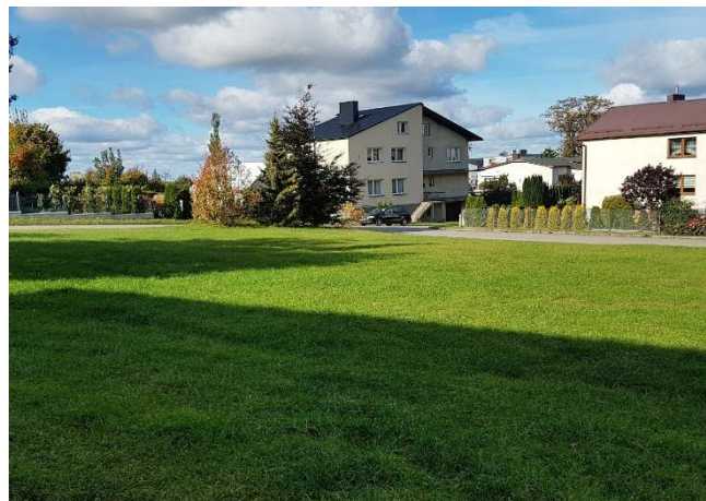
Zdj. 3. Teren inwestycji od strony południowej