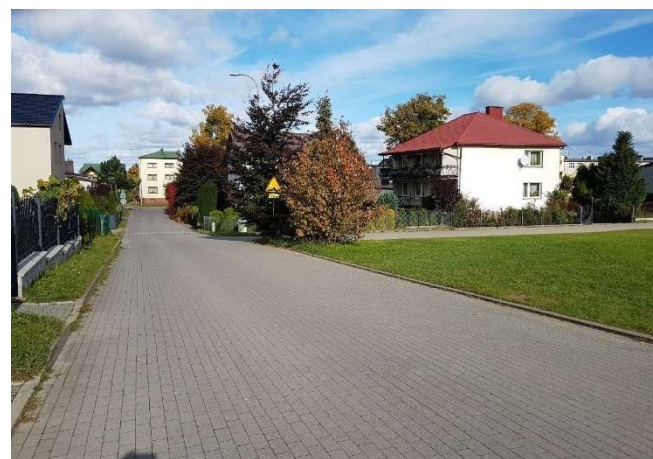
Zdj. 4. Ciąg komunikacyjny od strony zachodniej