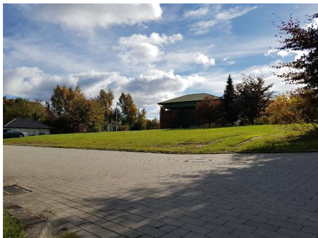
Zdj. 2. Teren inwestycji od strony północnej