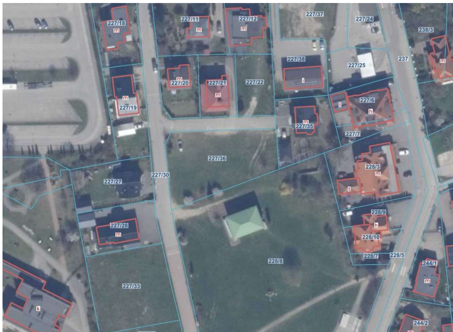
Rys. 1. Teren opracowania konkursowego (dz. nr 227/36) na tle ortofotomapy.