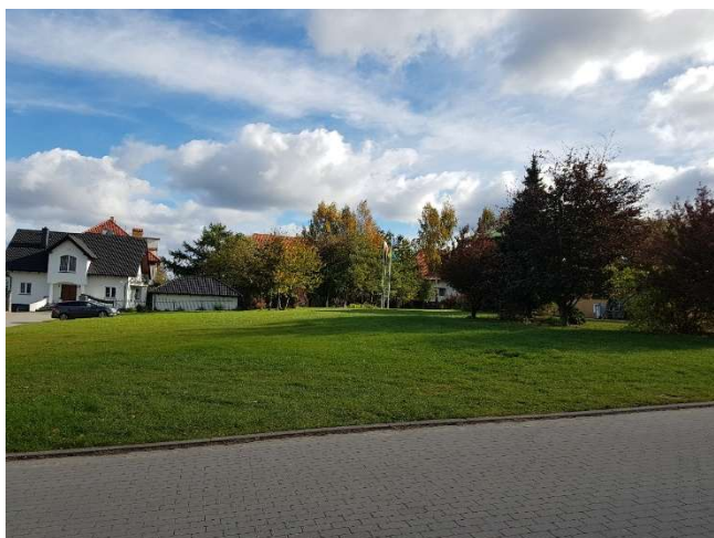
Zdj. 1. Teren inwestycji od strony zachodniej

Konkurs o wartości poniżej progów unijnych określonych na podst. art. 3 ustawy z dnia 11 września 2019 r. Prawo zamówień publicznych (Dz.U. 2024 r., poz. 1320 z późn. zm.)